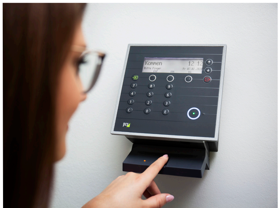
Moderne Systeme der Arbeitszeiterfassung arbeiten mit Fingerprint.

Der Referentenentwurf geht nunmehr von einer generellen Verpflichtung zur elektronischen Erfassung der Arbeitszeit aus. Diese Vorgabe wäre weder nach den gerichtlichen Entscheidungen noch nach der europäischen Richtlinie erforderlich. Im Ergebnis dürfte aber, unabhängig von der gesetzlichen Regelung, auf Dauer eine elektronische Erfassung der Arbeitszeit die praktisch sinnvollste Umsetzung der Verpflichtung sein.